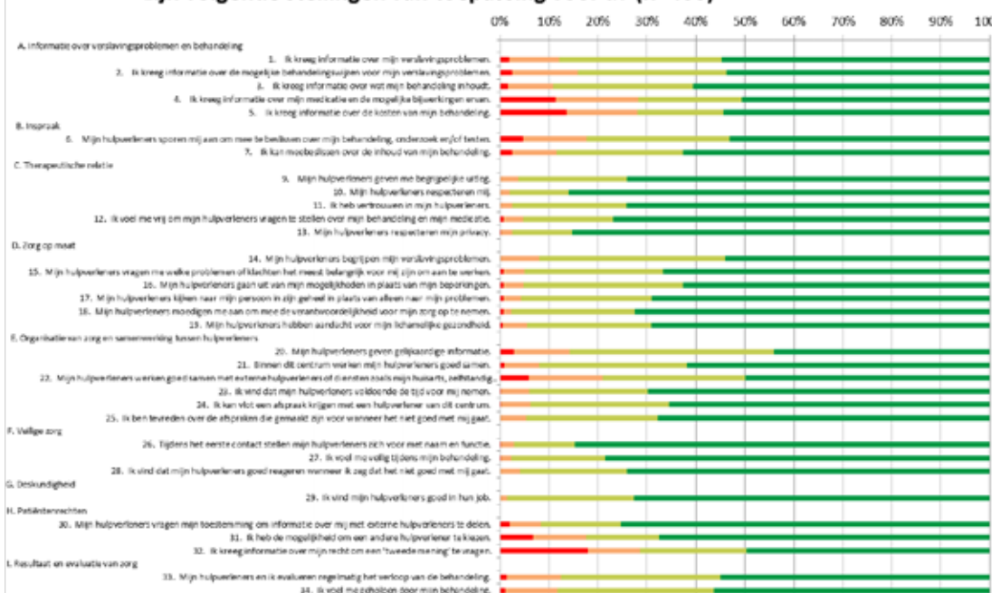
De Sleutel 2022 / Scores per kwaliteitsaspect: in welke mate zijn volgende stellingen van toepassing voor u? (n=400)